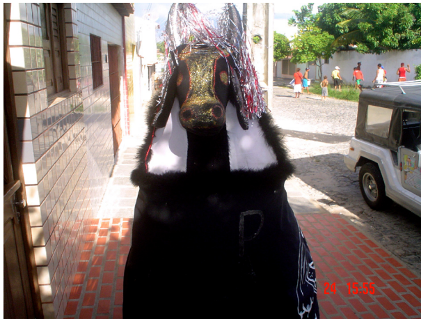
Imagem 06: Apresentação do Boi Pantera no Carnaval dos que Ficam

O pastoril também foi mencionado pelo presidente da SAB, como uma manifestação lembrada pelo povo. Côrtez et. al. (2004) aponta que o pastoril busca homenagear o nascimento de Jesus Cristo, através de uma dança simbólica.